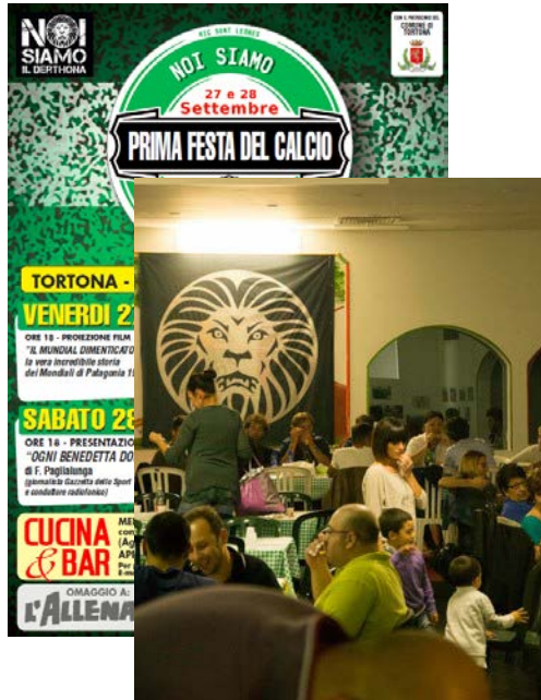
Festa del Calcio Settembre 2013