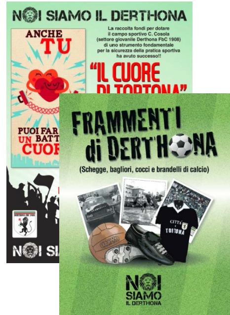
Il Cuore di Tortona Natale 2013