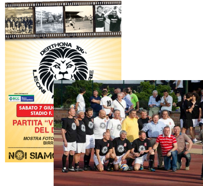
Leoni pe Sempre Giugno 2014